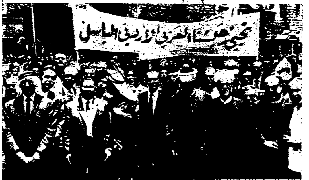
طلعية المسيرة الشعبية الفخمة التي شجعها المعلمة امس عمان - خرج الشعب الاردني امس عن بكره ابيه في مسيرة صالمة طلقت من حزيران من العلم الماسي ورافق المسيرة التي دعت اليها لجنة اتحاد القدس عقب المهرجان الشعبي الذي اقيم على المدرج الروماني عدد من الوزراء ورجال الدين والضيوف من أنحاء العالم . افتتاح المهرجان وفي الساعة الخامسة والنصف صباحا حيث احتشد حوالي عشرة الف مواطن في المدرج الروماني بدأ المهرجان الكبير بان وقع السيد عبد الرحيم مير حريف الفحل وقرأ القشورات البقية على صفحة ٤ عمود ٤

مهرجان صخر وسيرة شعبية في عمان الخطباء يسيدون بمحمود بلادن ويؤكدون صميمية النصر